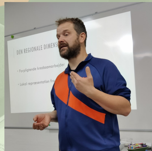
Kresten på besøg i Odsherred Lærerkreds

Husk at stemme. Du har 18 stemmer til rådighed, som du kan give til en eller flere. Alle stemmeberettigede medlemmer vil modtage en mail med et link til afstemning (tjek gerne på Min side, om vi har din korrekte mailadresse registreret). Skoler og afdelinger med over 80% afgivne stemmer får kage og ved 90% trækkes der lod mellem afdelingens medlemmer om et gavekort på 2 biografbilletter til Vig Bio. Læs mere på kredsens hjemmeside.